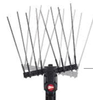
MOVIMENTO A BRACCI PARALLELI PARALLEL ARMS MOVEMENT MOVIMIENTO CON BRAZOS PARALELOS

1 VELOCITÀ - ASTA TELESCOPICA DA 235 cm a 315 cm 1 SPEED - TELESCOPIC POLE 235 cm to 315 cm 1 VELOCIDADES - VARILLA TELESCÓPICA 235 cm a 315 cm