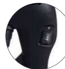
DOPPIA VELOCITÀ DOUBLE SPEED DOBLE VELOCIDAD