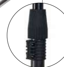
SERRAGGIO FAST BLOCK E ASTA CON ANTIROTAZIONE Fast Block tightening and anti-rotation pole Movimiento de espejo con brazos opuestos