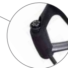
CONNETTORI FAST-PLUG FAST PLUG CONNECTIONS CONECTORES FAST-PLUG