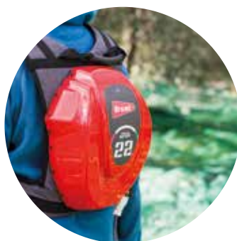
ZAINO ERGONOMICO ERGONOMIC SHOULDER BACKPACK

The special backpack with the ergonomic conformation and comfortable shoulder straps, allows the operator to carry the battery with no effort even after many working hours. Opposite to traditional lead-acid batteries, placed generally on the picking field, the battery backpack ensure a safe and simple job in every using conditions, even when working on higher branches.