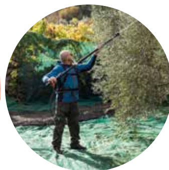
FINO A 8 ORE DI AUTONOMIA UP TO 8 HOURS WORKING